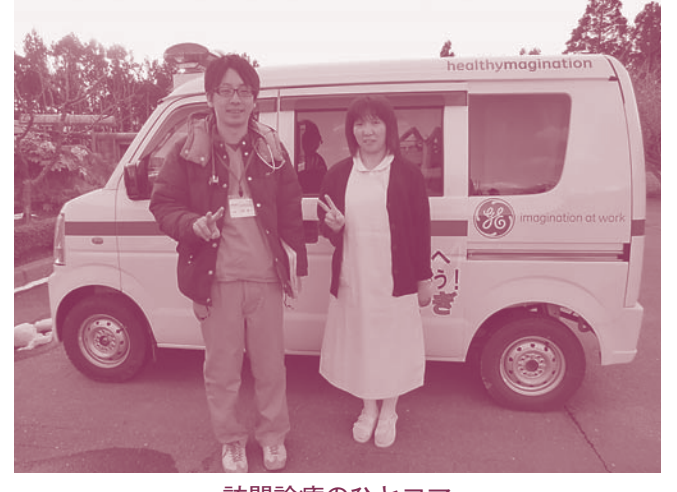
訪問診療のひとつ